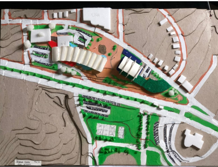
Imagem aérea da maquete e locação dos equipamentos

01 - Local o Centro de Reabilitação voltado para a Avenida Centenária. Aproveitando as árvores de grande porte existentes e criando um bolsão de acesso principal ao equipamento.