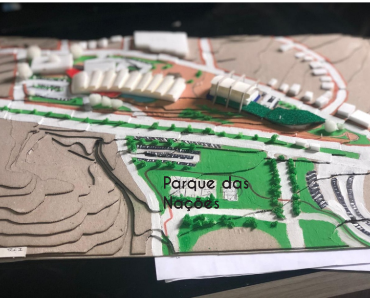
luso da topografia a favor do projeto Arquitetônico